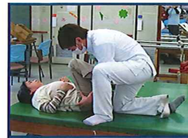
硬い関節をストレッチ

また、運動は「苦手だな…」という方や身体の痛みなどを緩和を目的として、軽めのリハビリとあん摩マッサージ指圧師によるマッサージも実施しております。当施設では、【理学療法士・言語聴覚士・柔道整復師・あん摩マッサージ指圧師】などの専門的な資格を持っている職員を配置しております。