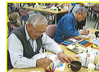
カレンダー作りの風景