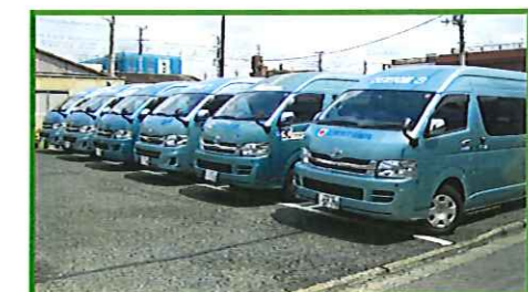
☆ お待ちしております ☆