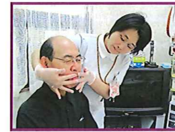
言語訓練のひとつコマ