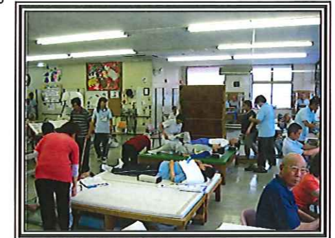
～リハビリ室の風景～