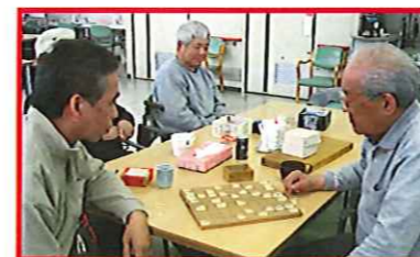
つつい力が入ります

左のページでご紹介した、集団体操や趣味活動などの様子です。当施設では、基本的なサービス内容は決まっておりますが、ご利用者様によって1日の流れが変わってきます。運動に集中したい方は、午前中に個別リハビリと集団体操に参加し、午後からも残った個別リハビリメニューや自主トレを実施するというのも良いかもしれません。また、活動やレクリエーションへの参加や他の利用者様との交流も楽しみたい方は、午前中のうちに個別で実施する機能訓練を実施し、午後からご希望される活動を楽しむというのも良いでしょう。ご希望の全てに添うことはできませんが、1日の過ごし方を決めるのはご本人様次第です！！